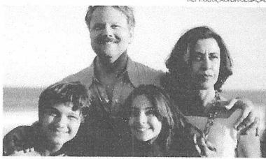
No Oscar, o filme concorre em três categorias

O longa baseado no livro de mesmo nome de Marcelo Rubens Paiva, um dos filhos de Eunice, é focado em como Eunice enfrenta o regime após o desaparecimento de